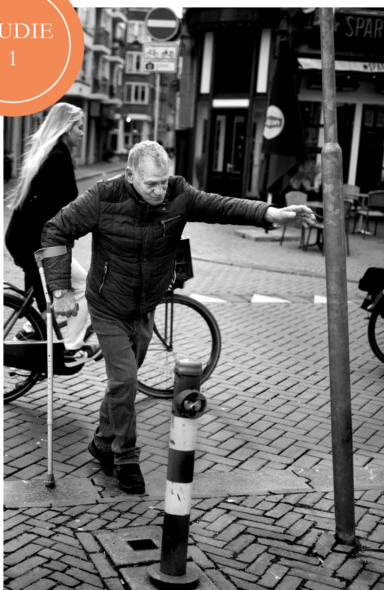
HERSTEL FYSIEK FUNCTIONEREN NA EEN HEUPFRACTUUR VERSCHILLENDE