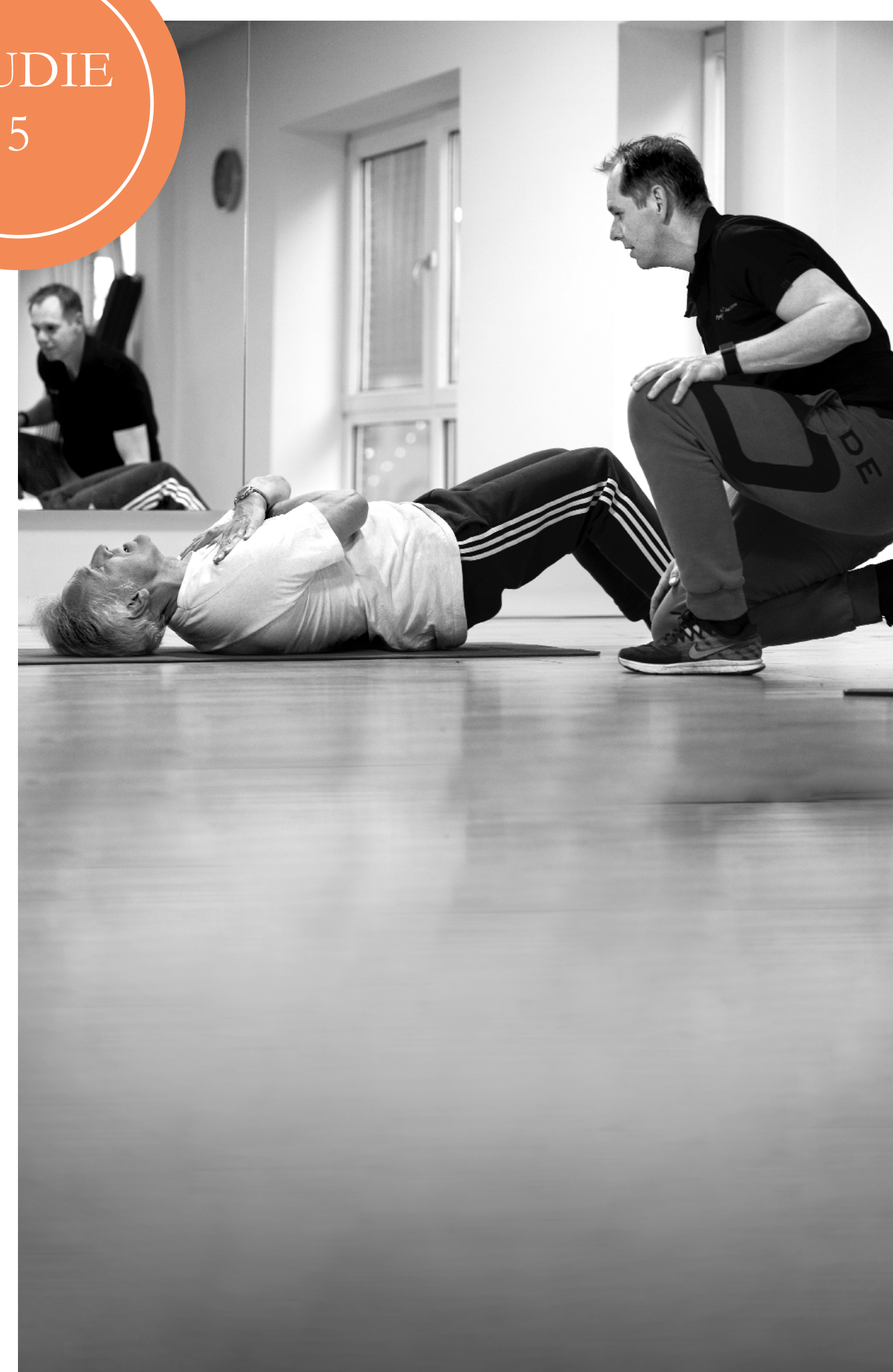
OEFENEN OM FUNCTIEVERLIES TE VOORKOMEN