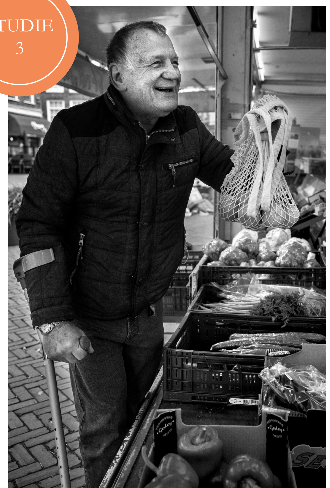
SPIERMASSA/SPIERKRACHT AFNAME EN HERSTEL FYSIEK FUNCTIONEREN NIET COMPLEET