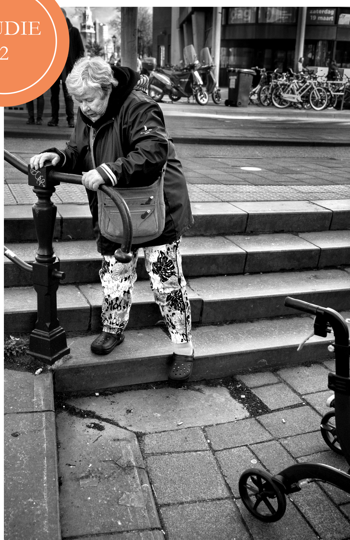
SPIERKRACHT GERELATEERD AAN FYSIEK FUNCTIONEREN